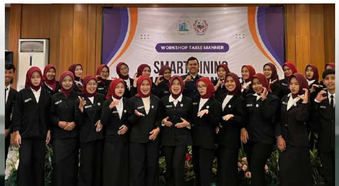
PELATIHAN TABLE MANNER