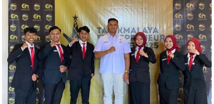
TASIKMALAYA ENTREPRENEUR AWARD