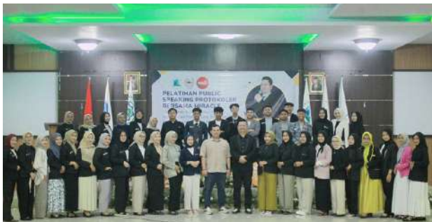
PELATIHAN PUBLIC SPEAKING